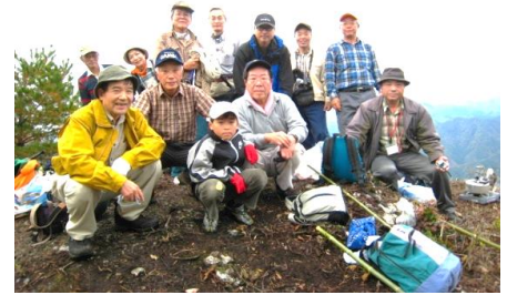
遠見山展望台(745m)にて

今回は氷の山ネイチャークラブ(HNC)主催の遠見山登山(標高805m)に八東川清流クラブ(HSC)も参加する交流登山。参加者は14名(内HSC4名、小学生1名)。晴天に恵まれ気分も明るくワイガヤと登って行く途中、あちこちに鹿や猪の足跡、そして熊のタメ糞を発見し気が引き締まる。色とりどりの落葉で埋まる山道を登りながらHNCの山本代表より、木々の名前や特徴を聞く。さすがに博識、勉強になる。5合目以降の急峻な登りを遂げて、9合目辺りにある展望台に着く(登山口から約2時間)。皆心地良い達成感を味わいつつ、眼下に広がる一大景観に歓声をあげる。自分達の村々や小・中学校そして八東川が流れゆく先の方まで、東西南北一望できる。また、氷ノ山、扇ノ山、目を転じて伊呂の山、そして風車の空山等々も遠望でき、正に360度の素晴らしいパノラマ展望である。 「遠見山(とおけんざん)とは、遠くまで見える山(遠見山(とおみやま))という意味で名付けられたのだろう」とガッテンいく。昼食後、少し奥の山頂に登るが見晴らしもきかず、すぐ下山にかかる。ところが、下山途中に、思いがけずも遠見山からの素晴らしいお土産を戴くことになった。それは、なんと立ち枯れ木に群生する“なめこ茸”である。遠見山の自然の豊かさ素晴らしさを一層感じつつ無事下山。遠見山に初めて登り、眺望の素晴らしさと、八東川の清流を育む落葉樹の多い豊かな自然をもつこの山を、今後も大切に守り続けていかねばならないという思いを強くしました。最後にHNCとHSCの今後の交流連携を誓い解散。HNCの皆様ありがとうございました。(中村 顕)