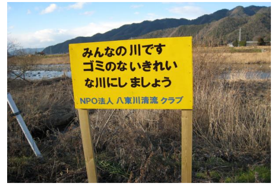
才代地区下部の左岸に設置された看板

この看板は会員が仕事の合間を利用し、苦勞しながら大作業やペンキ塗り作業等を行い手作りで作成したものです。この看板により地域の皆さんへゴミ捨て防止のメッセージが届き、八東川のゴミが少なくなることを期待したいものです。