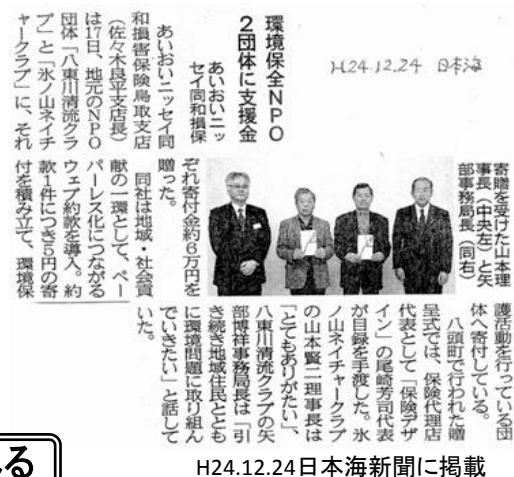
H24.12.24日本海新聞に掲載

同寄付金は、全国で約130団体、鳥取県下では氷ノ山ネイチャークラブと並んで2団体に贈呈されています。来年度も予定されるそうです。