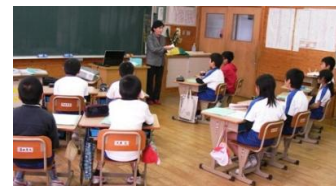
安部小学校出前授

HSCは5～10月にかけて、八東川清掃・源流探検・いかだ作り・水生生物調査・出前授業等を4年生と一緒に活動しました。