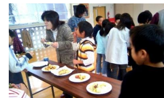
八東小学校に招待