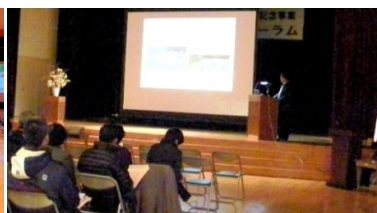
八東川水生物調査報告