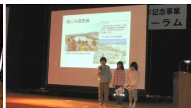
八東小学校4年生の発表