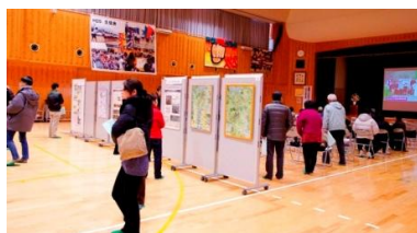
会場全景・展示物